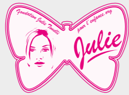
FONDATION JULIE TONELLI