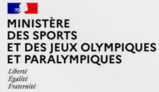
MINISTÈRE DES SPORTS