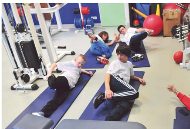
Cours de préparation physique