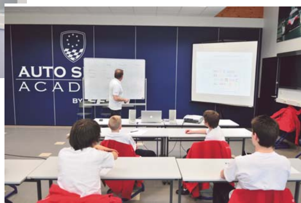
Conférence sur les médias