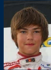
Pierre Gasly Né le 7 février 1996 Catégorie : KF3 Equipe : Sodikart Programme : Championnat de France, d'Europe et Coupe du Monde