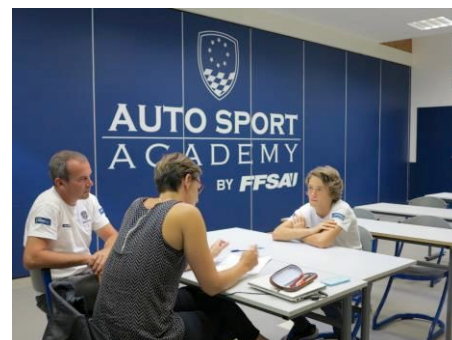
L'Équipe de France FFSA Karting en stage à l'Auto Sport Academy avant le Championnat du Monde à Essay